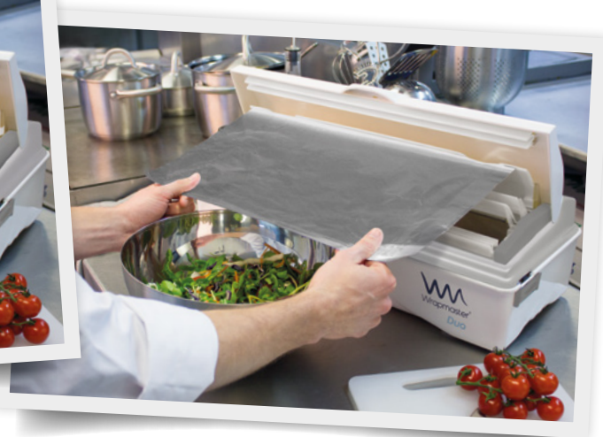
Für den Gebrauch mit 45cm Wrapmaster® Nachfüllrollen